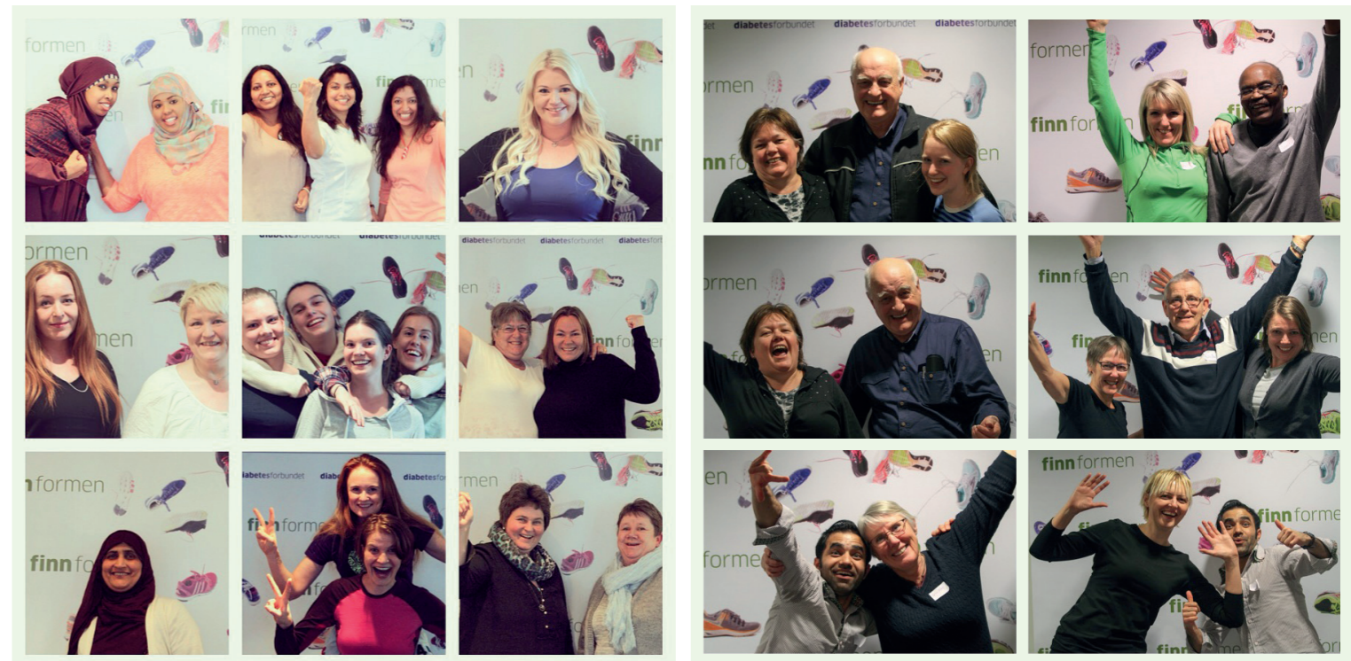
Gøy på kurs! Bildene er fra kurset i Trondheim 5. mars og Oslo 12. mars.