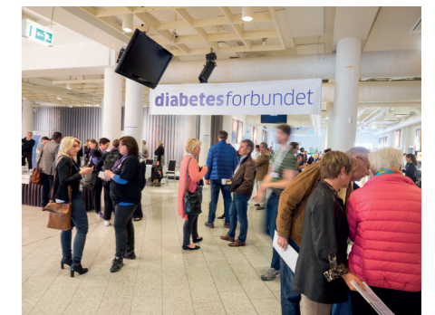
Pausene ble brukt til blant annet å slå av en prat, bygge nettverk og besøke stands.

– Diabetesomsorg er flerfaglig. Vi med diabetes trenger oppfølging fra ulike yrkesgrupper. For eksempel får vi hjelp av legen med det medisinske, sykepleieren med både veiledning og opplæring knyttet til tekniske hjelpemidler, ernæringsfysiologen med råd om kosthold, og apotekeren møter oss der utstyr blir utlevert.