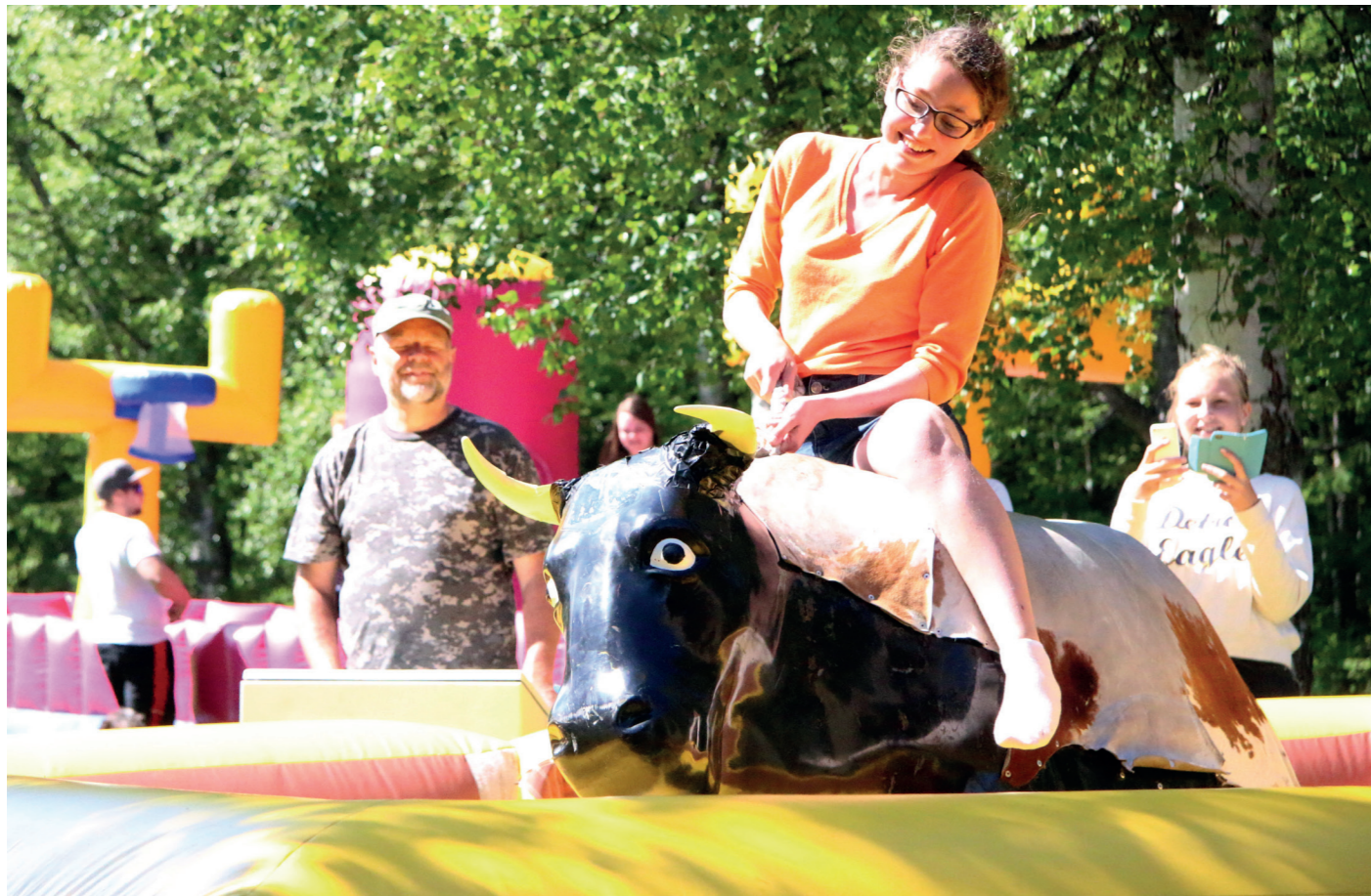
Mekanisk okse var en av aktivitetene på Hurdalsjøen.