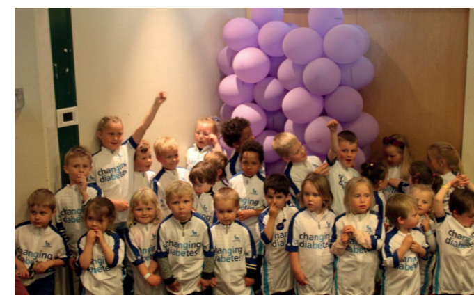
Det var stor stas å møte andre barn med diabetes, og inntrykkene var mange for denne gjengen.

I tillegg ble det utarbeidet en veileder for barne- og familiekontakter i forbundet. Denne ble presentert på årsmøtene i mars.