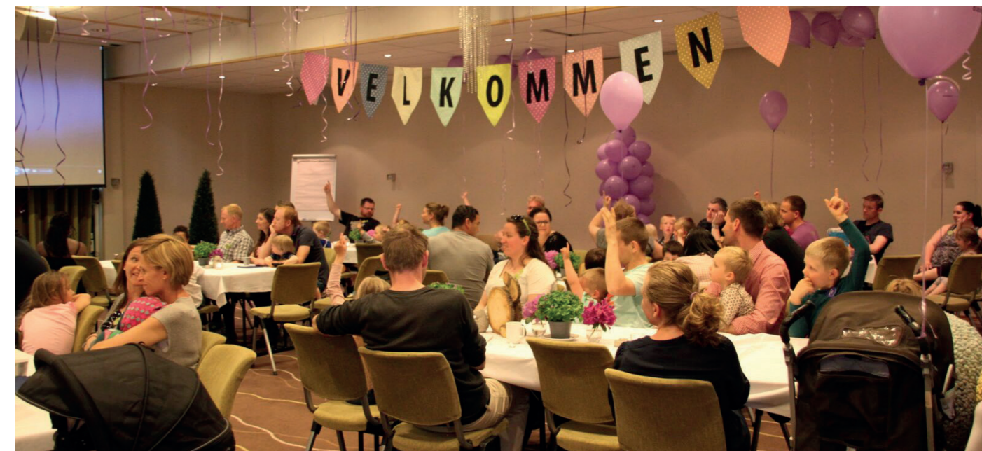
Til sammen 31 barn med diabetes, 27 søsken og 61 voksne deltok på samlingen.

I dagene før 14. november var ansatte i Diabetesforbundets sekretariat aktive i morgen- og ettermiddagsrushet i Oslo med utdeling av informasjonsmateriell. Nærmere 2.000 mennesker fikk konsertflyer og julebaksthefte i hånden.