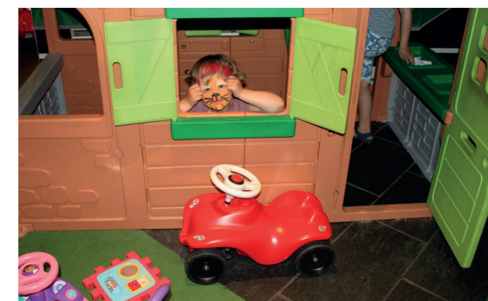
Barna som ønsket det fikk ansiktsmaling. En av dem satt på lur i lekehuset.