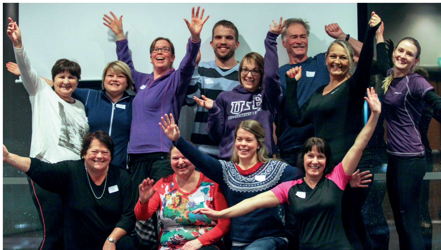
Fornøyd gjeng på Finn Formen-kurs i Bergen 5. mars.

* I tillegg har alle fylkeslag hatt besøk fra sentralstyret