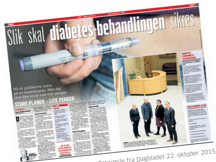
Faksimile fra Dagbladet 22. oktober 2015.

Diabetesforbundet skal følge tett opp for at en handlingsplan skal føre til en bedre helsetjeneste for personer med diabetes. I 2015 var vi godt i gang med å jobbe for at dette blir en plan som forplikter, og som det settes av penger til.