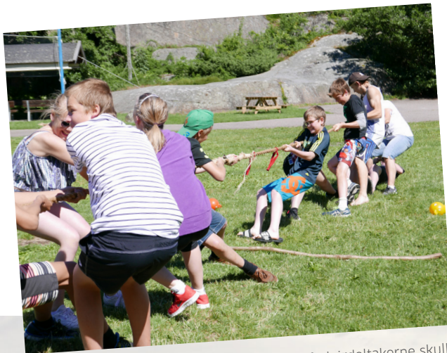
DRAGKAMP: Stor innsats når leirdeltakerne skulle avgjøre hvem som var sterkest.

Sommerleiren var en suksess, og det var mange fornøyde deltakere som dro hjem ved sommerleirens slutt.