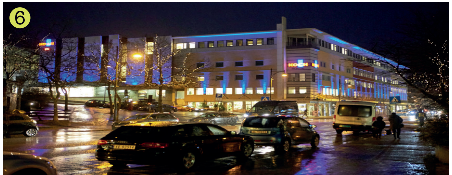
1 Norge i Rørvik. 2 Borre kirke. 3 Nordlyskatedralen. 4 Karasjok gamle kirke. 5 Holmennokken i Drammen. 6 Bodø i blått.