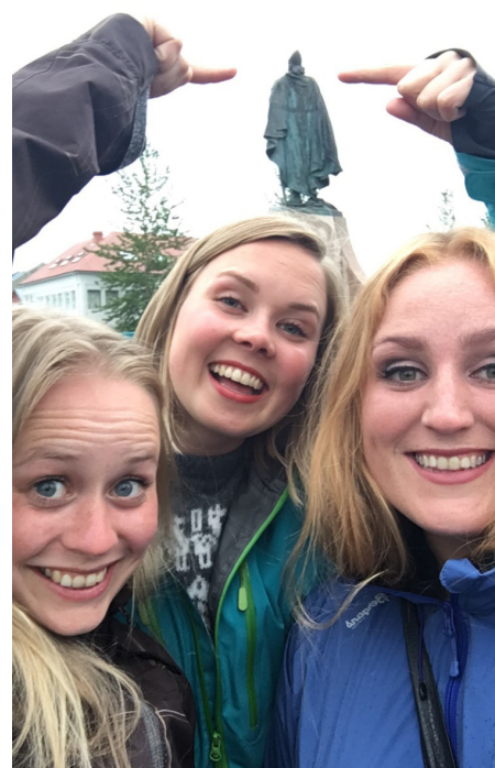
PÅ ISLAND: Representantene fra de nordiske diabetesorganisasjonene, unntatt Færøylene som ble forhindret fra å delta på møtet.